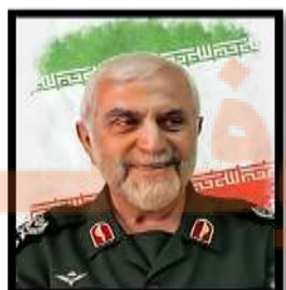
۳. شهید مجتبی ذوالفقار نسب