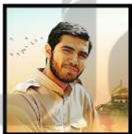
۲. شهید حاج حسین همدانی