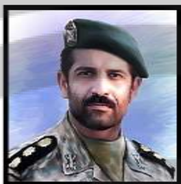
۱. شهید محمدرضا دهقان