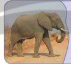
الفیلُ حیوانٌ کَبِیرٌ.