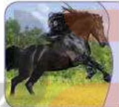
الفَرَسُ حیوانٌ نَجِیبٌ.