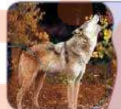
الذَّنْبُ حیوانٌ حَرِیصٌ.