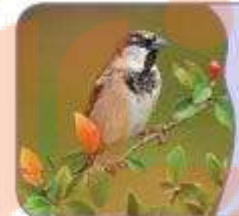
العُصْفُورُ طائرٌ صَغِیرٌ.