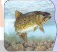
السَّمَكَةُ فی النُّهْرِ.