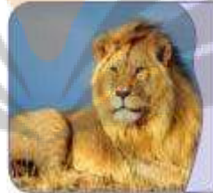
الأسدُ سلطانُ العَابَةِ.