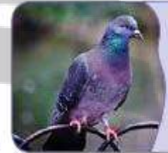
الْحَمَامَةُ طائرٌ جَمِیلٌ.