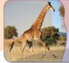
الزَّرَافَةُ حیوانٌ طَوِيلٌ.