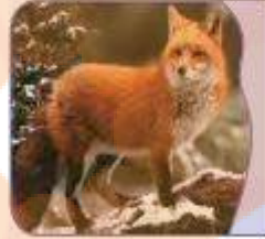
الثَّعْلَبُ حیوانٌ مَكَّارٌ.

الْحَمَامَةُ / الذَّنْبُ / الزَّرَافَةُ / العُصْفُورُ / السَّمَكَةُ / الفِيلُ / الفَرَسُ / الأسدُ / الثَّعْلَبُ