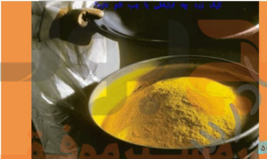
کیک زرد چه ارتباطی با هم دارند؟